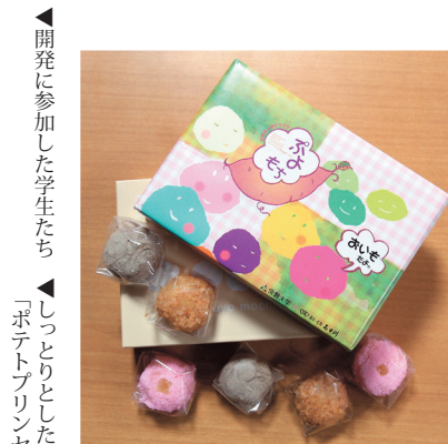
▲一口サイズで食べやすい「ぶよもち」

商品には、いずれも茨城町産のさつまいもが使用されています。「ぶよもち」はさつまいも餡をぶよぶよのお餅で包んでおり、季節ごとにそれぞれ3つの味が期間限定で楽しめます。また、「常磐の宝箱 ポテトプリンセス」は焼きいもペーストの中にリンゴが入ったスイートポテトです。